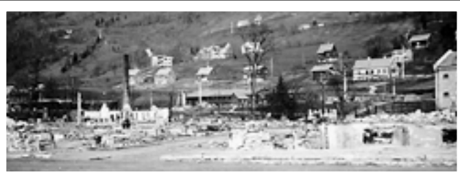
RUINER: Voss mai 1940.

Da det blir nødvendig å rapportere til sjefen for 9. kompani at vi